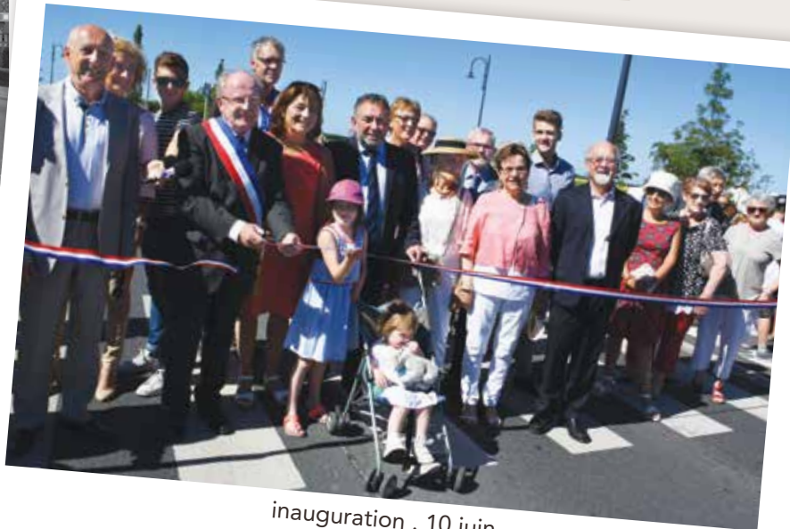
inauguration . 10 juin

La RD 910 a été réaménagée pour un coût total de 2 565 100 €, avec une subvention à hauteur de 38 %.