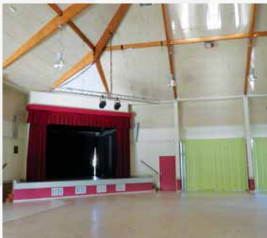
réhabilitation thermique de la salle des fêtes et peinture des loges