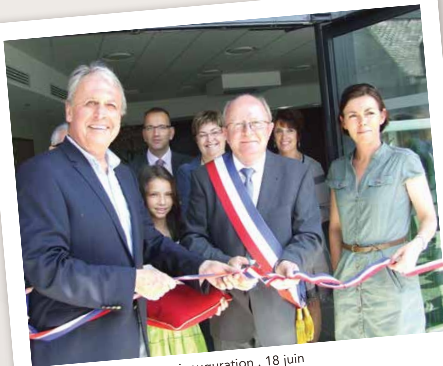
inauguration . 18 juin