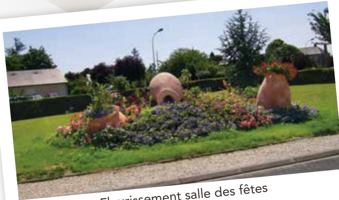
Fleurissement salle des fêtes

Aménagement de la rue de Saint-Branchs pour 232 638 €. Ce coût contient l'éclairage public, la mise en place des fourreaux pour l'enfouissement des réseaux, l'assainissement des eaux pluviales, la réalisation des places de parkings, la réalisation du carrefour en croix, les plateaux, les écluses et les chemins piétonniers. Une subvention a été obtenue pour 105 000 € et la couche de roulement a été prise en charge par le Conseil départemental.