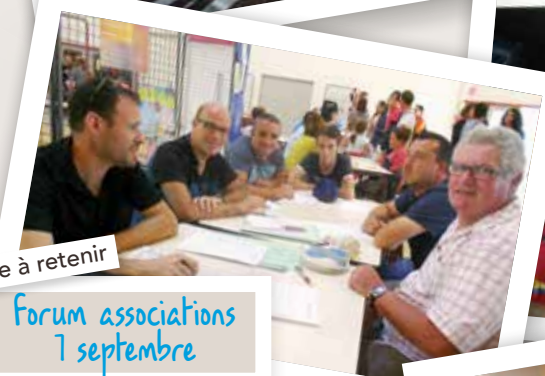
Date à retenir