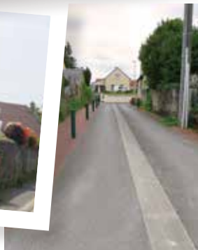
rue du puits