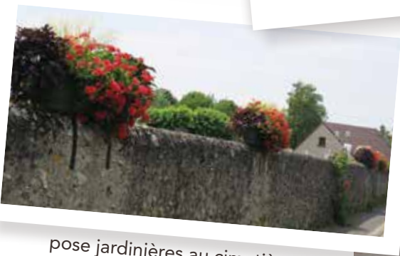
pose jardinières au cimetière

Modification du réseau d'assainissement des eaux usées, rue de la Voie Dieu suite à la destruction de la station d'épuration et de la mise en service de la nouvelle sur Isoparc pour 117 879 €.