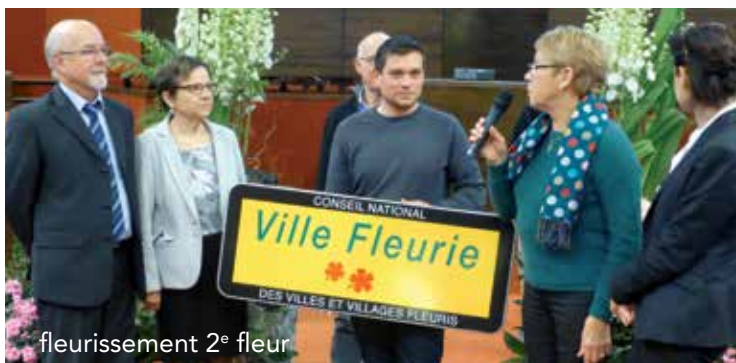
fleurissement 2° fleur