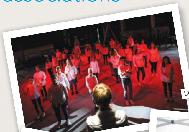
Date à retenir