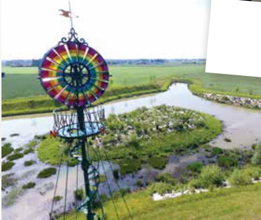
bassin de pêche