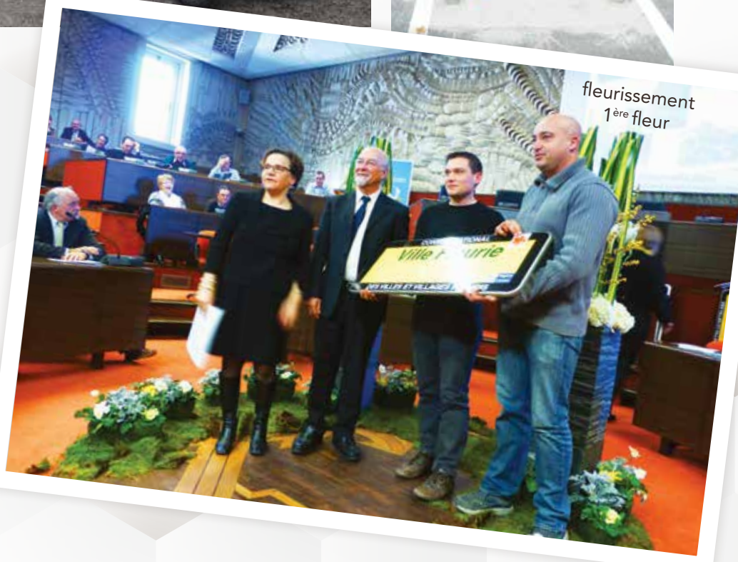
fleurissement 1 ère fleur

Acquisition d'un véhicule électrique pour les services techniques pour 24 529 €.