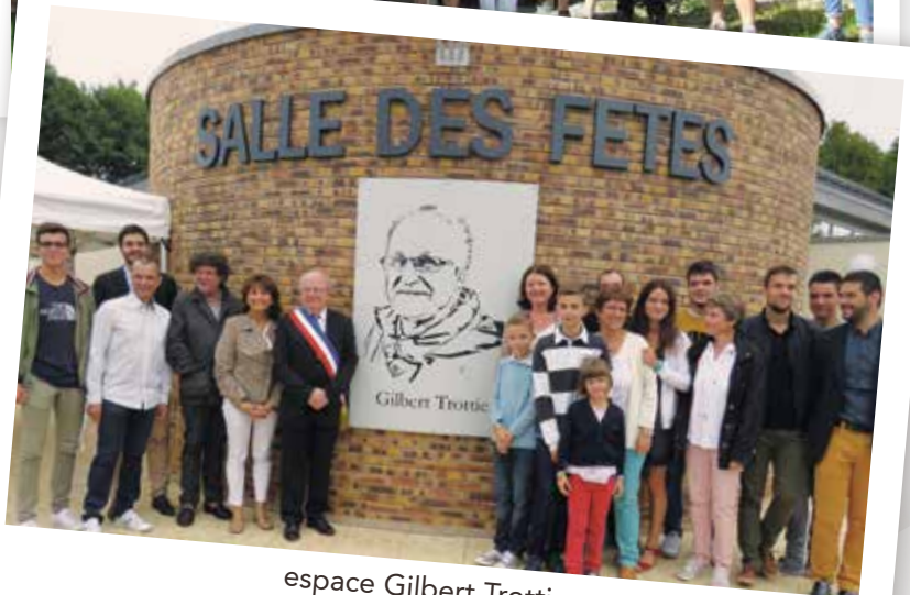
espace Gilbert Trottier