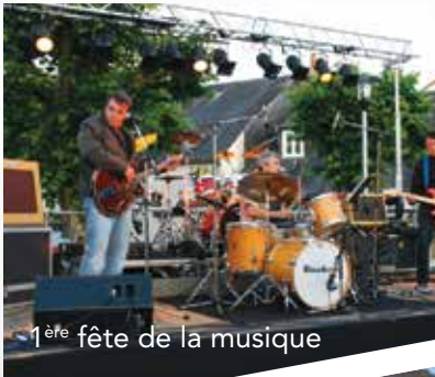
1 ère fête de la musique