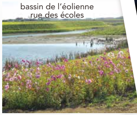
bassin de l'éolienne rue des écoles