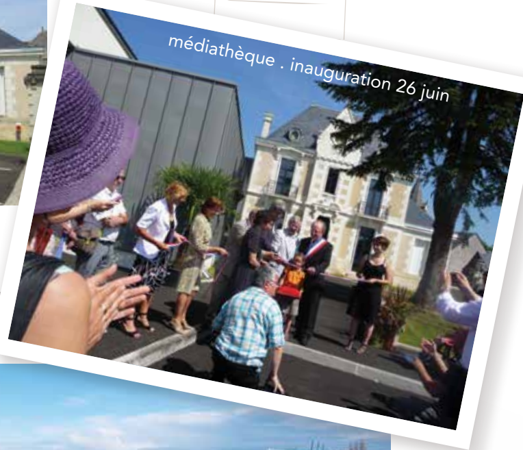
médiathèque . inauguration 26 juin