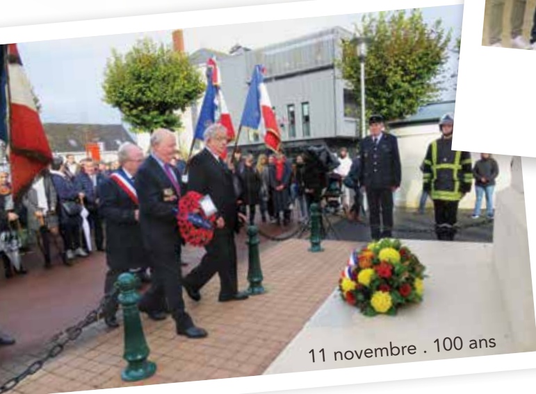
11 novembre . 100 ans