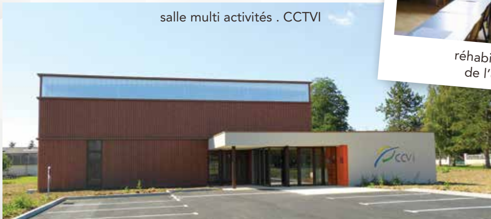
salle multi activités . CCTV