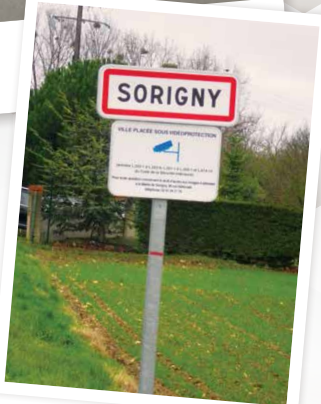
mise en place de la vidéo protection

2014 - 2016 . Travaux d'aménagement de la rue des Courrances pour un montant de 240 851 €. Ce coût contient l'élargissement de la voirie, la mise en place de l'éclairage public, la mise en place des fourreaux pour l'enfouissement des réseaux, l'assainissement des eaux pluviales, la réalisation du carrefour en croix, les plateaux et les chemins piétonniers. Une subvention de 11 % a été obtenue.