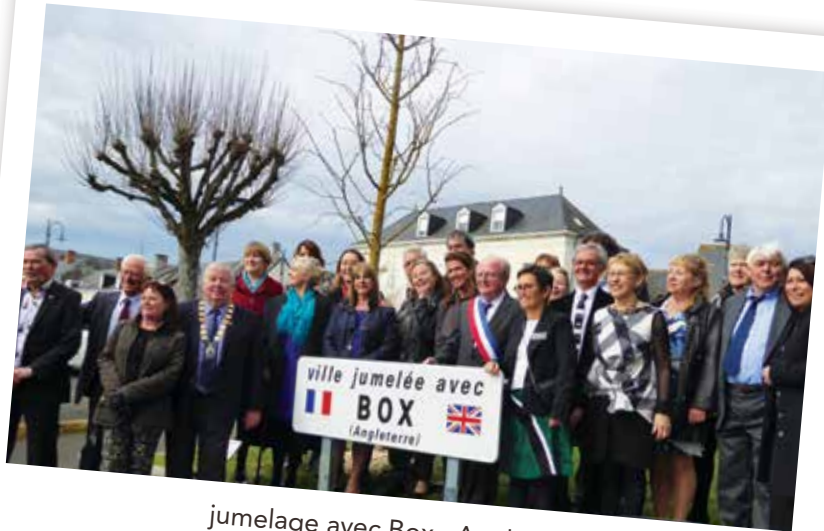
jumelage avec Box . Angleterre