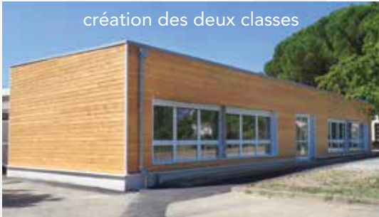
école élémentaire Jacqueline Auriol création des deux classes