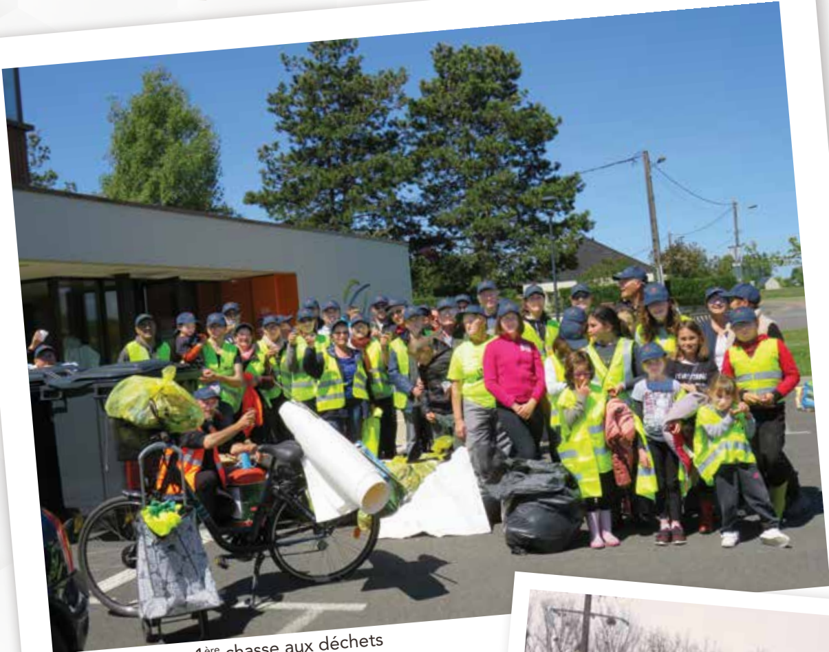
1 ère chasse aux déchets

2014 - 2016 . Travaux d'aménagement de la rue des Courrances pour un montant de 240 851 €. Ce coût contient l'élargissement de la voirie, la mise en place de l'éclairage public, la mise en place des fourreaux pour l'enfouissement des réseaux, l'assainissement des eaux pluviales, la réalisation du carrefour en croix, les plateaux et les chemins piétonniers. Une subvention de 11 % a été obtenue.