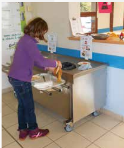
restaurant scolaire table à déchets

Réhabilitation énergétique de l'école élémentaire pour 139 477 €. La subvention obtenue a couvert 68 % du montant des travaux.