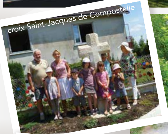
croix Saint-Jacques de Compostelle

Aménagement de la rue du puits pour 21 781 €. Une subvention a été obtenue pour un montant de 4 400 € (Amendes de police).