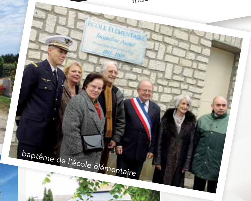
baptême de l'école élémentaire