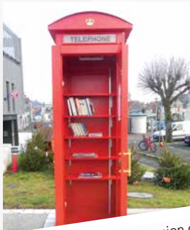
boite à livres