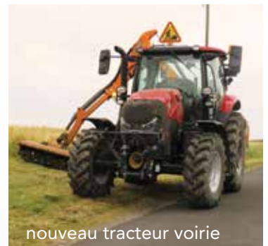
nouveau tracteur voirie