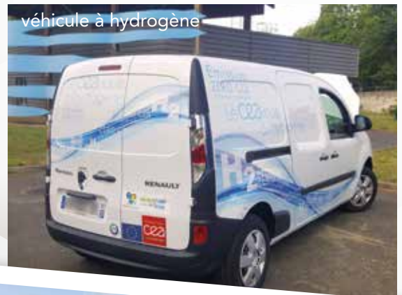
véhicule à hydrogène

Réhabilitation d'une maison afin d'accueillir les pèlerins de Compostelle pour 27 470 €.