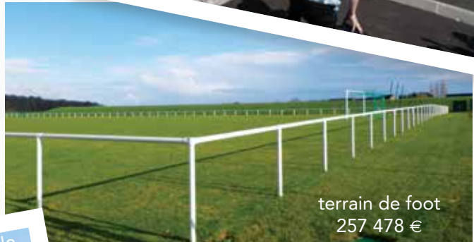
terrain de foot 257 478 €

Renforcement du réseau d'eau potable afin d'éviter les bâches incendie sur la ZAC de Genevray, entre la RD 910 pour 78 097€.