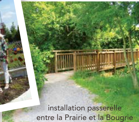
installation passerelle entre la Prairie et la Bougrie