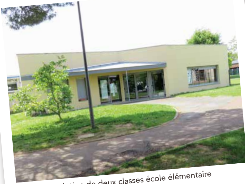
création de deux classes école élémentaire