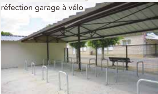
réfection garage à vélo

Création de deux nouvelles classes à l'école élémentaire, extension du préau et réfection du garage à vélo pour 437 825 €. Investissement financé pour 38 % par la DETR.