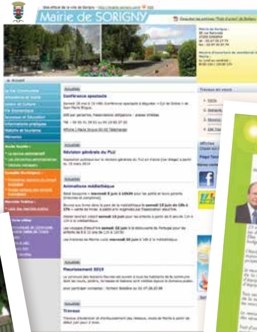
création du site internet