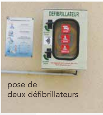
pose de deux défibrillateurs