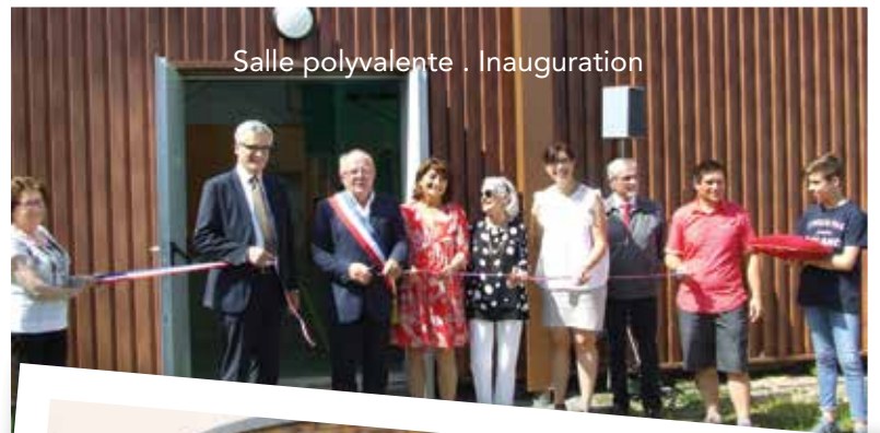
Salle polyvalente . Inauguration

Le coût des travaux est de 357 023 €. Les subventions représentent 66 % du montant total.