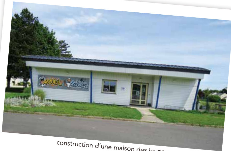
construction d'une maison des jeunes 336 752 €