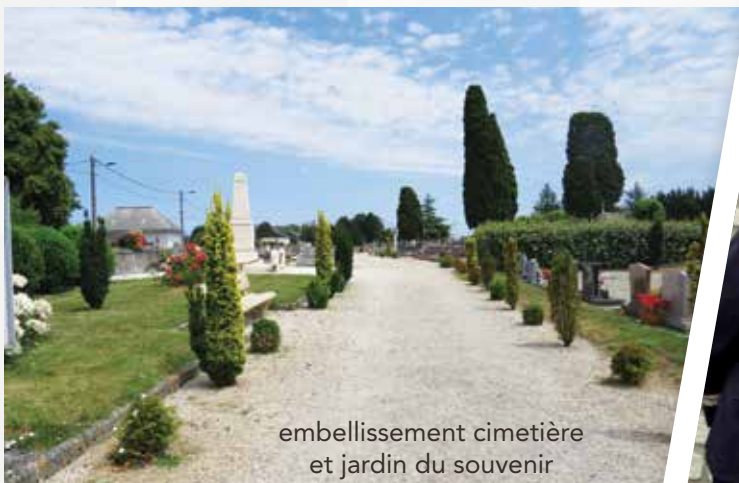
embellissement cimetière et jardin du souvenir