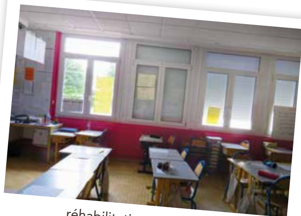
réhabilitation énergétique de l'école élémentaire

Réhabilitation énergétique de la salle des fêtes et peinture des loges pour 276 694 €. Ces travaux ont été subventionnés à hauteur de 83 %.