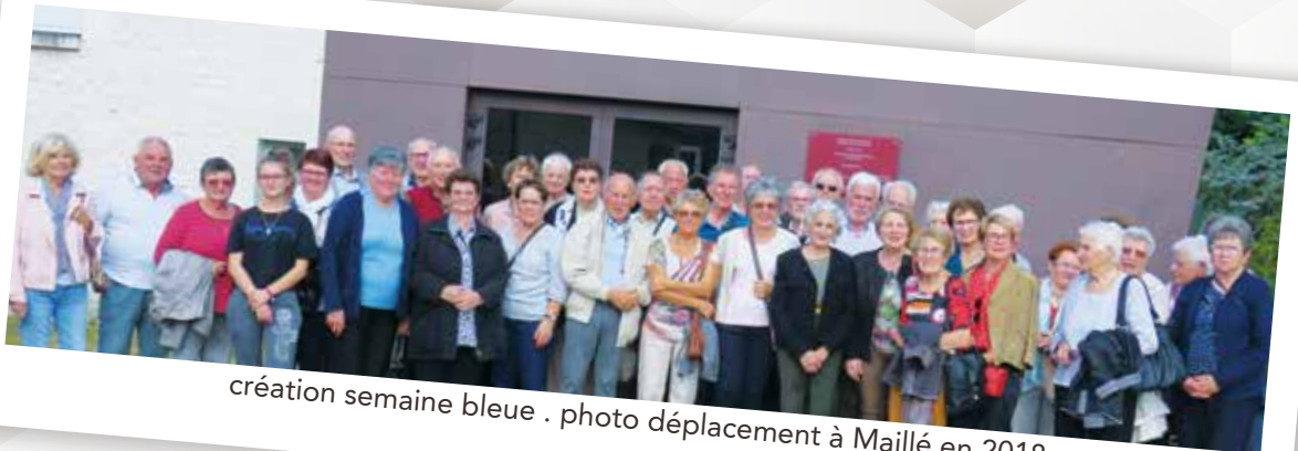
création semaine bleue . photo déplacement à Maillé en 2018