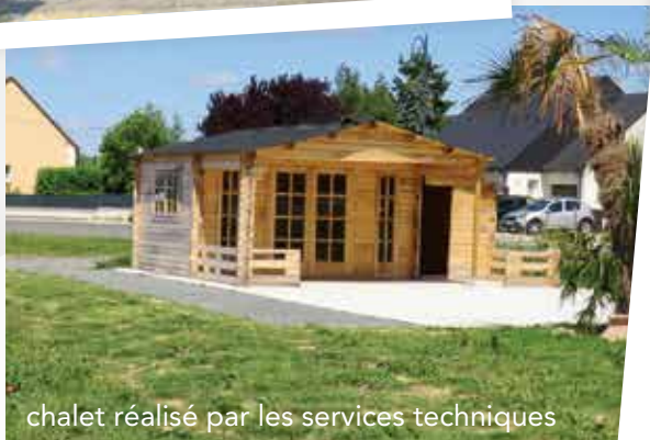
chalet réalisé par les services techniques