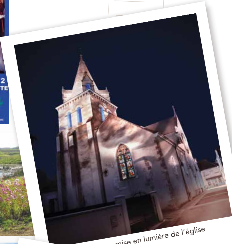
mise en lumière de l'église