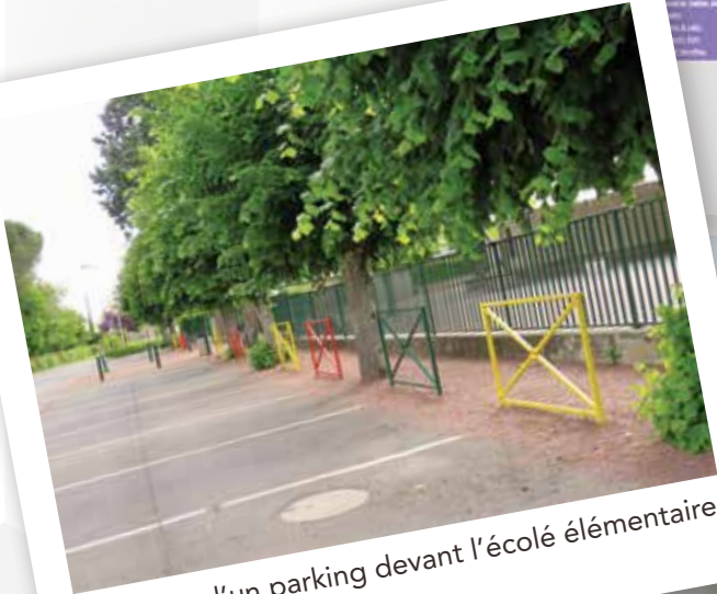
création d'un parking devant l'école élémentaire

Aménagement du parking de l'école primaire par BSTP pour 14 350 €.