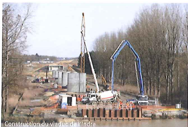
Construction du viaduc de l'Indre