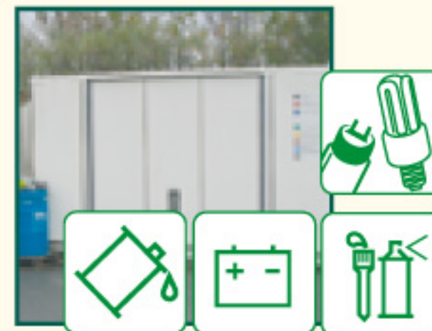
Les Déchets Ménagers Spéciaux (petite quantité, moins de 20 kg)