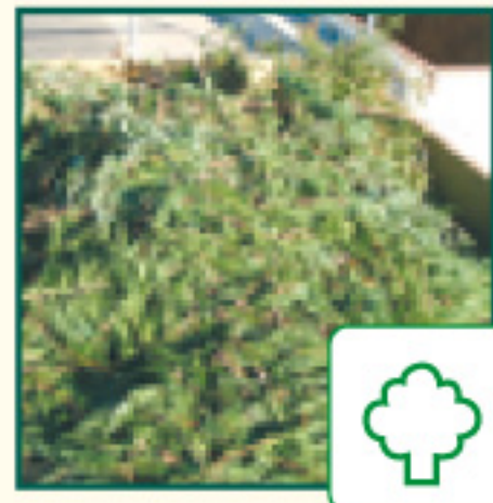
Les Déchets végétaux