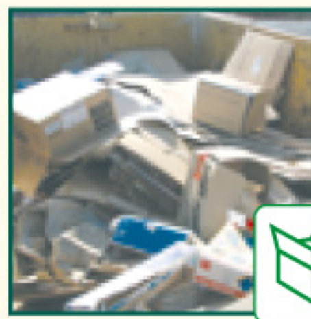
Les Papiers, cartons