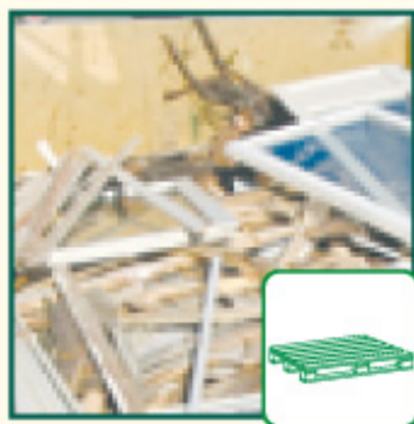
Les Déchets de bois